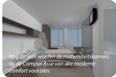
Nog dit jaar worden de materniteitskamers op de Campus Asse van alle moderne comfort voorzien.