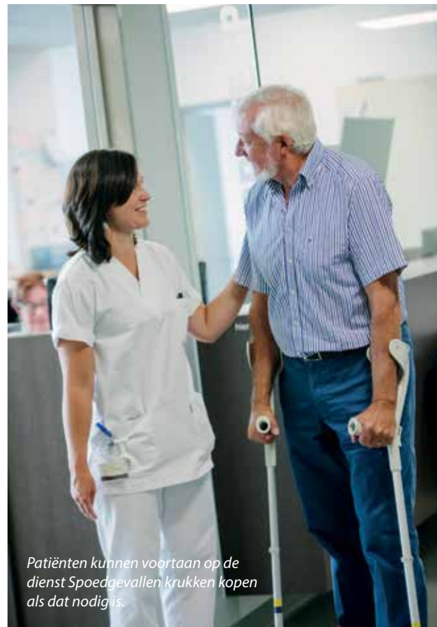
Patiënten kunnen voortaan op de dienst Spoedgevallen krukken kopen als dat nodig is.

Op de dienst Geriatrie is de dienstverlening aan de patiënt eveneens uitgebreid. Diverse loophulpmiddelen – vierwielrollator, tweewielrollator, looprek – zijn nu op voorschrift in stock beschikbaar. Verder zijn op de afdeling aangepast bestek en bekens, lange schoentrekken, toiletverhogers, antislipmatjes en aangepast verzorgingsmateriaal te koop.