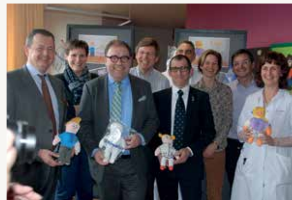
Met de poppen van Kiwanis kunnen kinderen hun angst en onzekerheden tijdens hun ziekenhuisverblijf overwinnen.

Met dank aan de lokale Kiwanisclub voor de schenking van de poppen.