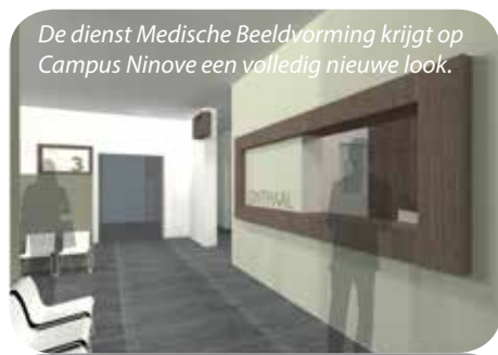
De dienst Medische Beeldvorming krijgt op Campus Ninove een volledig nieuwe look.