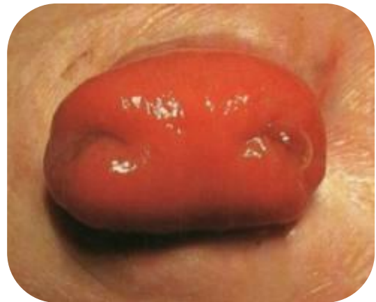
Dubbelloops of loopstoma