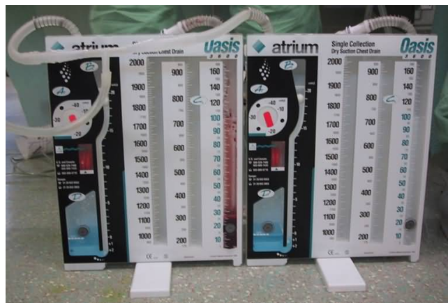
Figuur 3b: thoraxdrain