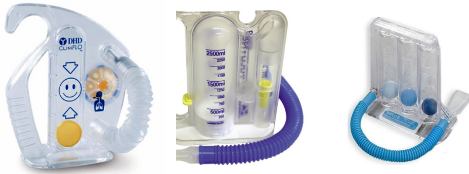
- Figuur 4: ademhalingstrainer