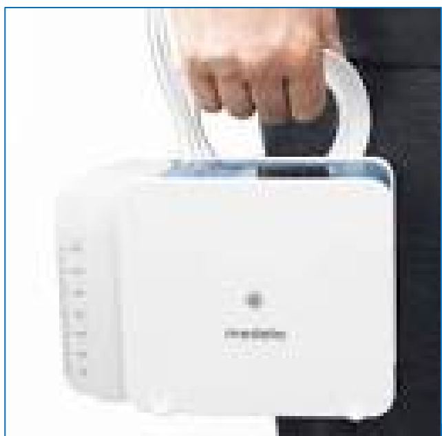
Figuur 3c: thoraxdrain